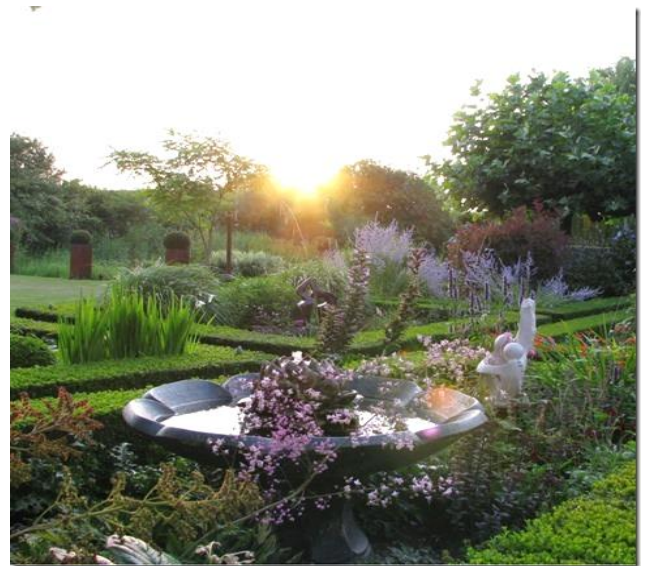
De Houtenhandsche Hof

vertrek Ca. 15.30 - aankomst Middelburg , vrije tijd.